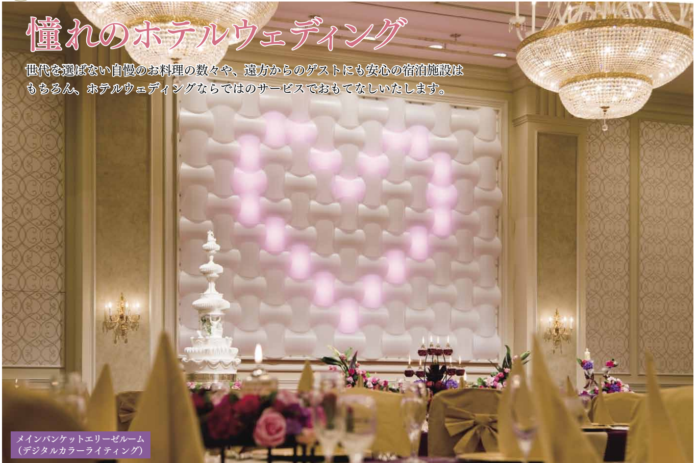
メインバンケットエリーゼルーム (デジタルカラーライティング)

世代を選ばない自慢のお料理の数々や、遠方からのゲストにも安心の宿泊施設は もちろん、ホテルウェディングならではのサービスでおもてなしいたします。