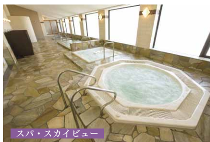
スパ・スカイビュー